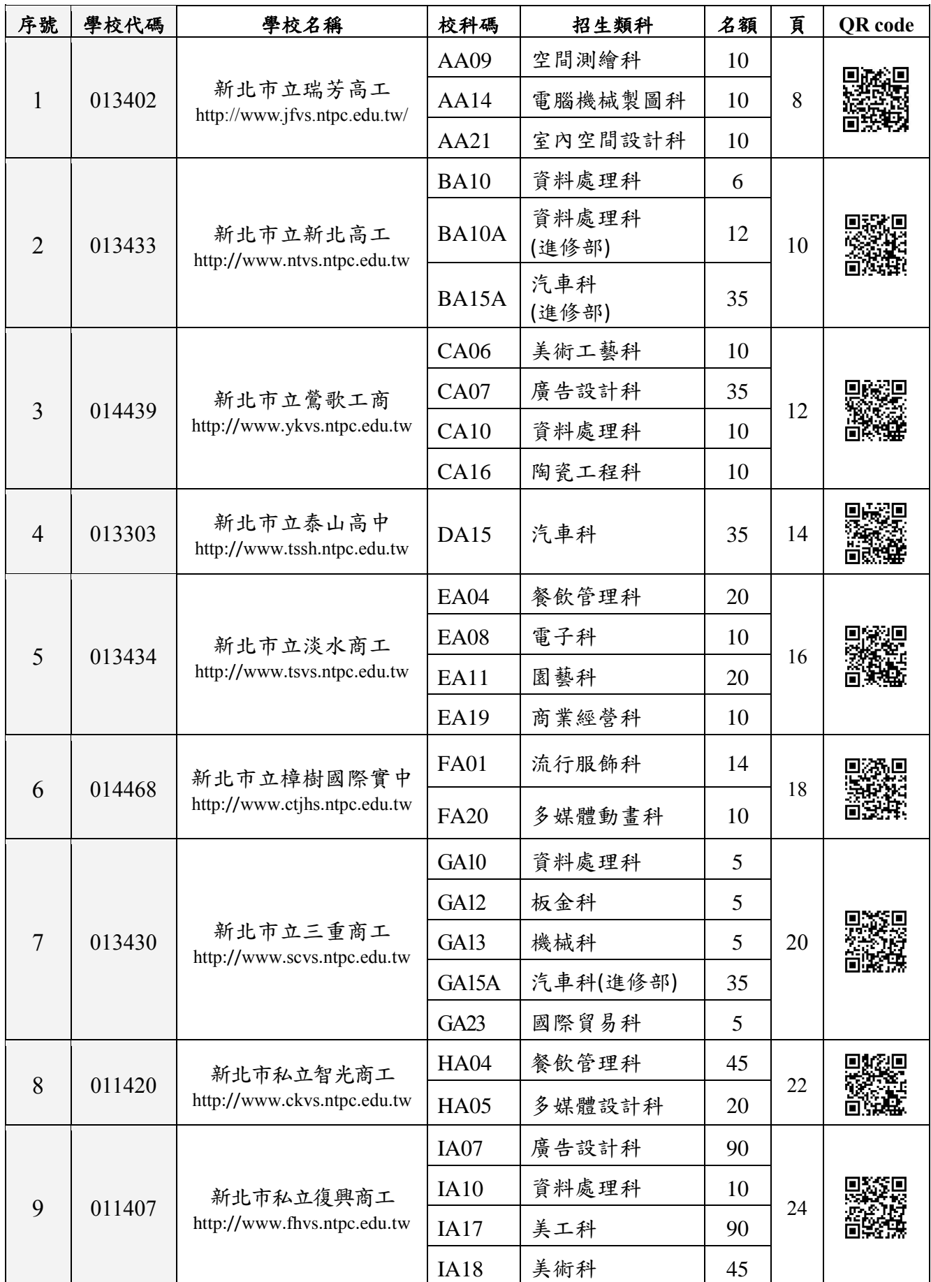
新北市 110 學年度高級中等學校特色招生專業群科甄選入學學校一覽表